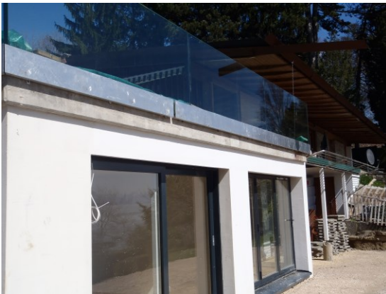
Portes-fenêtres spéciales sur terrasse à la plage privée