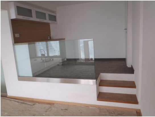
Cuisine, toute neuve.

par l'entreprise « Evergreen », CH-1276 Gingins.