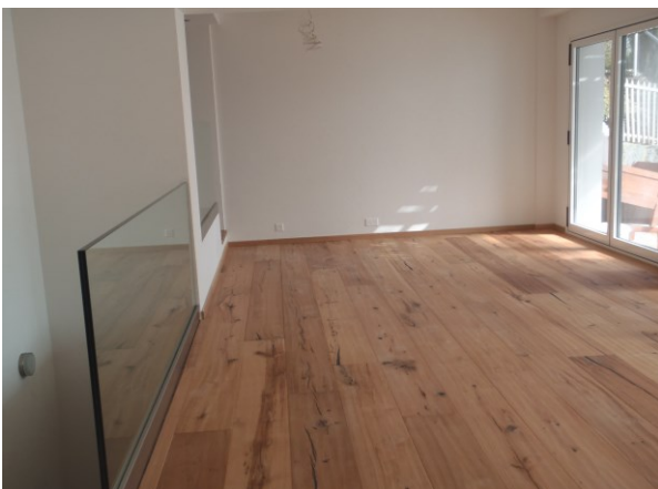
Séjour, accès à l'extérieure et sous-sol studio « rock » et l'isolation phonique spéciale.